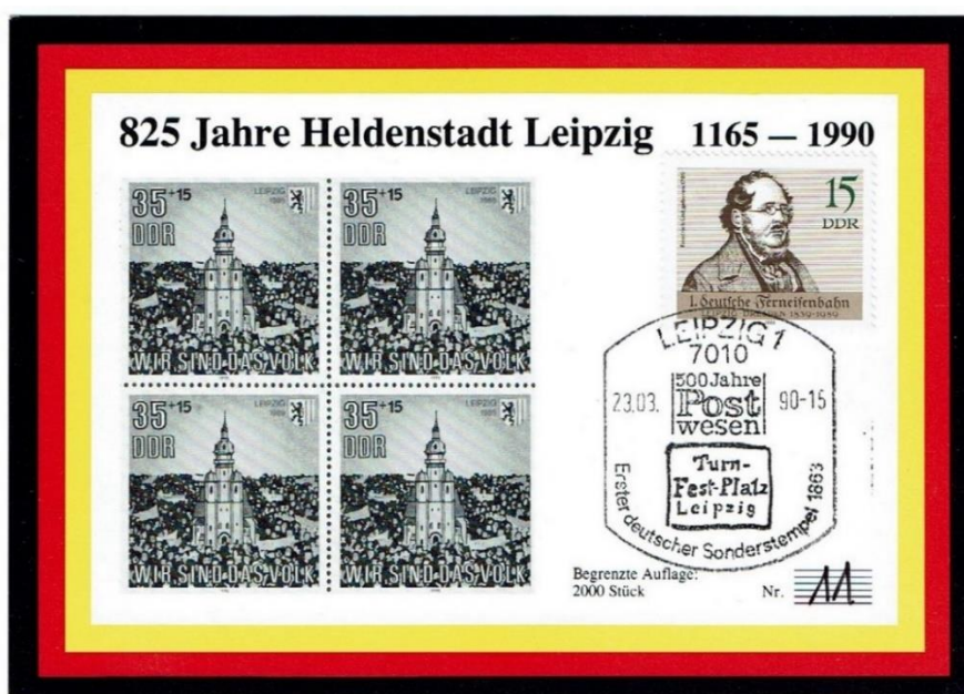
Angebliche Maximumkarte „825 Jahre Heldenstadt Leipzig“ , anonymer Herausgeber, fehlende thematische und zeitliche Übereinstimmungen zwischen Briefmarke, Kartenmotiv und Sonderstempel: